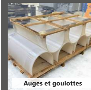
Auges et goulottes