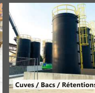
Cuves / Bacs / Rétentions