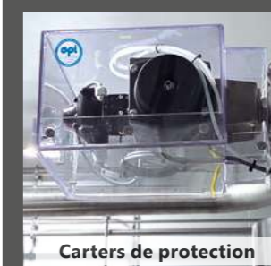
Carters de protection

Créations ♦ Modifications ♦ Raccordements